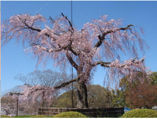
↓ 圓山公園有名的枝垂櫻