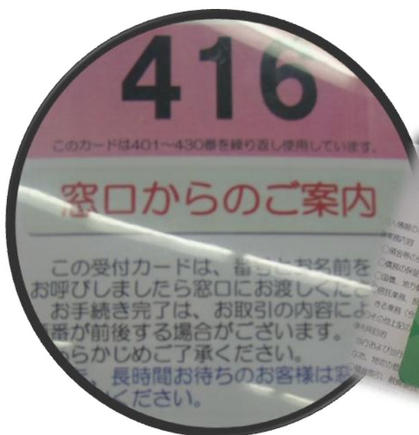
↑ 去銀行辦事先把待辦事務交給行員之後， 會拿到號碼牌，就可以坐著等人叫囉！