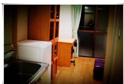
→ ↑ 要陪我度過一整年的小屋~ 有小廚房還有浴室 ↓ 我可愛的小床

爲了在日本生活，除了最重要的外國人登錄證之外，還必須申辦國民保險及銀行帳戶。不過這一系列的重要文件學校都會安排行程輔助留學生辦理，只要準備好所需東西，就不用擔心囉。