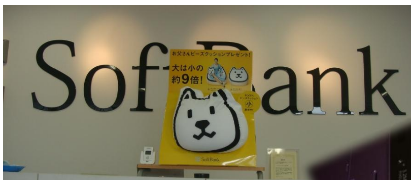
在 SoftBank 辦的手機