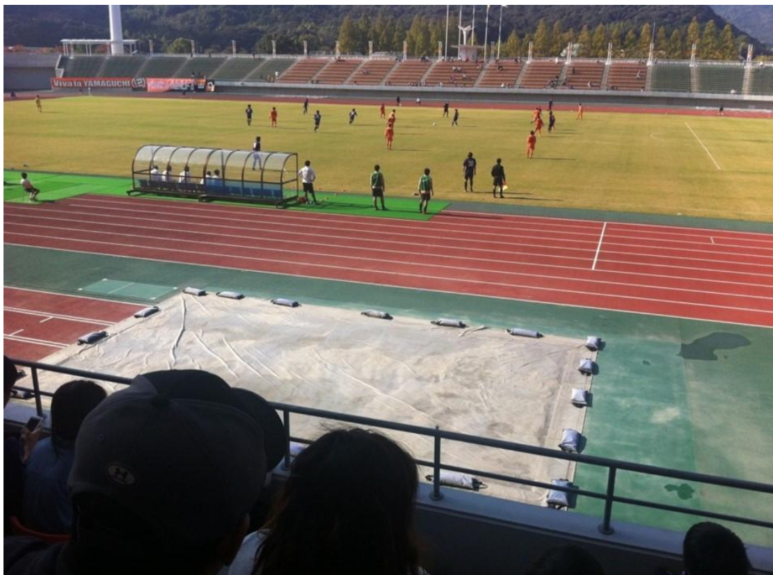
觀看山口維新公園的足球比賽

看完了也差不多坐末班車回山口囉！十月底，廣島足球隊的來山口比友誼賽，學長是足球迷，所以我也跟這去了，我對足球說實話是沒什麼興趣，不過現場看的氣氛果然不一樣，最後還是由職業的廣島隊大勝！