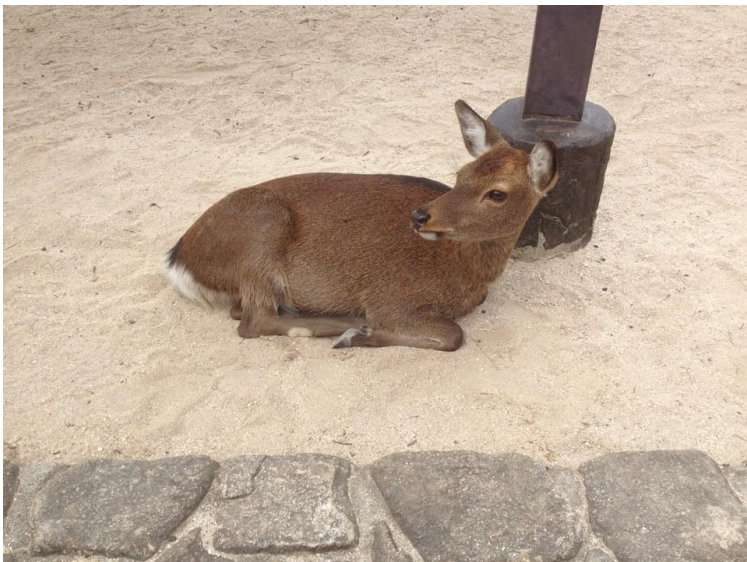
路邊休息可愛的鹿