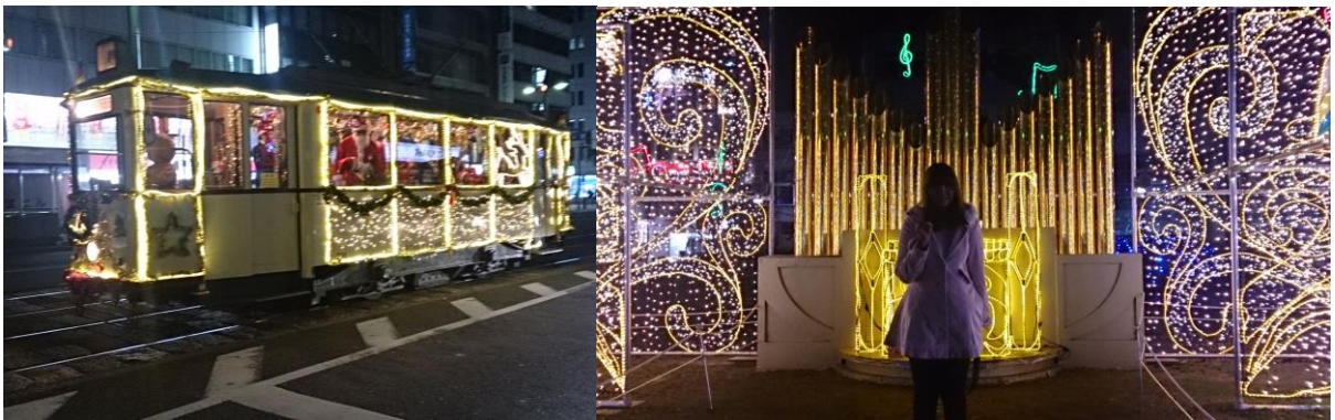
廣島的路面電車整個變成聖誕電車了！右邊的則是平和通りのイルミネーション！