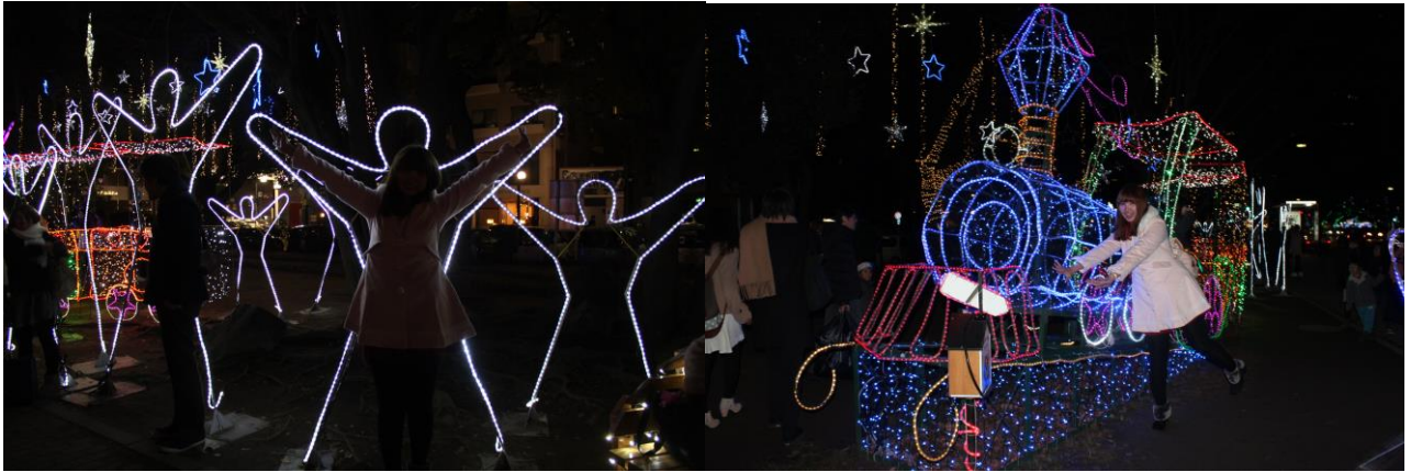
右邊照片的情境是我沒趕上火車的想像哈哈。