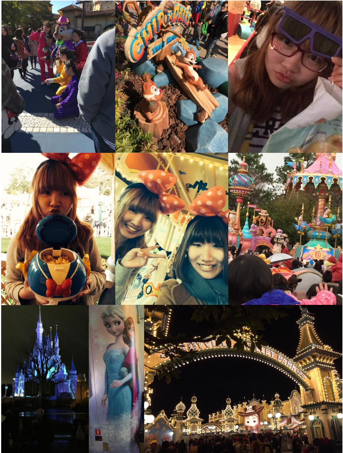
全寫的話就感覺像是在寫遊記了，所以就貼貼照片給大家看看囉～！正中央那張是我前年認識的日本朋友，去廣島大學短期