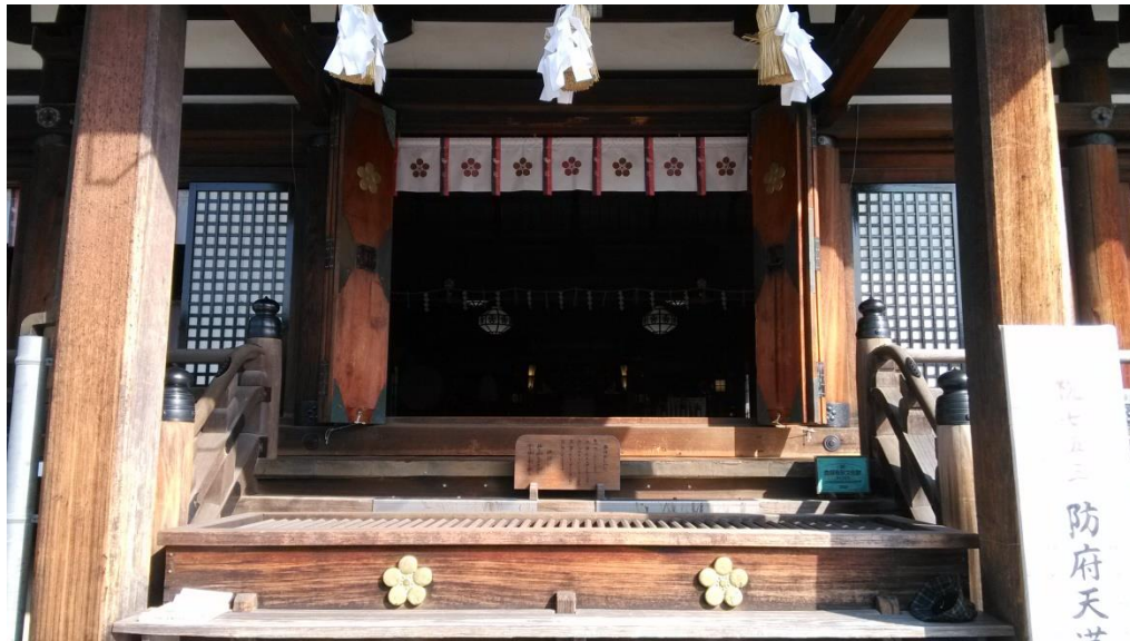
←丟香油錢跟參拜地方(參拜前記得先洗手漱口)