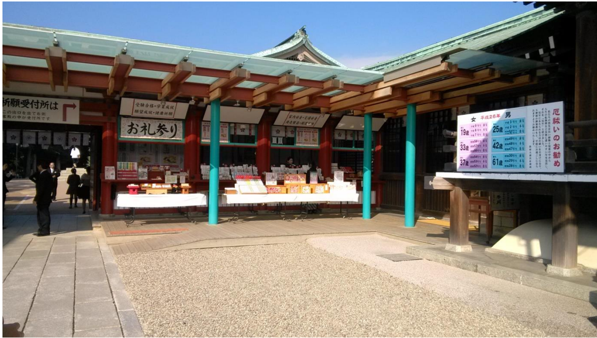
天滿宮很大，當天剛好遇到有人在辦結婚儀式，看到了傳統日本女子整身白的結婚衣服！真是幸運。