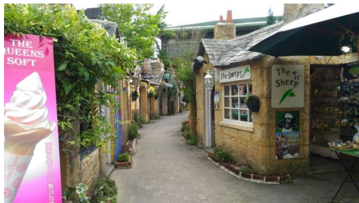
童話村真的好可愛啊~ 整個少女心大開~