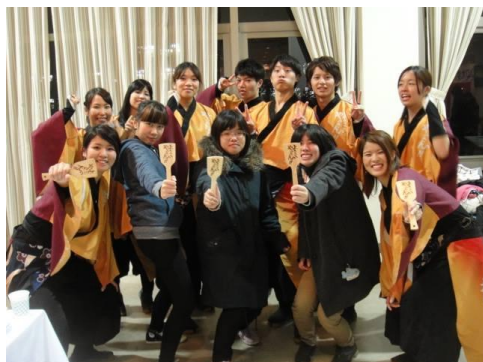
當晚山口就 0 度了。

最後一週有留學生懇談會，各式各樣的美食及音樂舞蹈表演，其中有一個是日本傳統的舞蹈，很像ソーラン但不是ソーラン，更加輕快愉悅，一種名為よさこいの舞，是高知縣よさこい祭り跳的舞，日研社以後可以考慮跳這個。