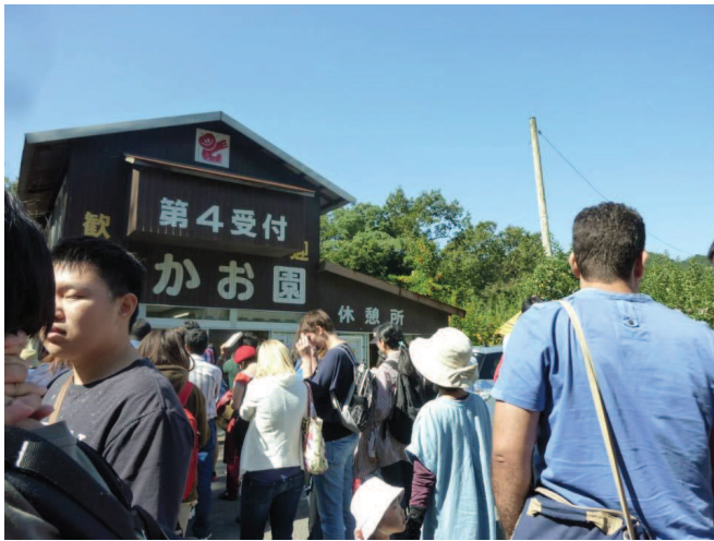
10/13 りんご狩り 採蘋果之旅